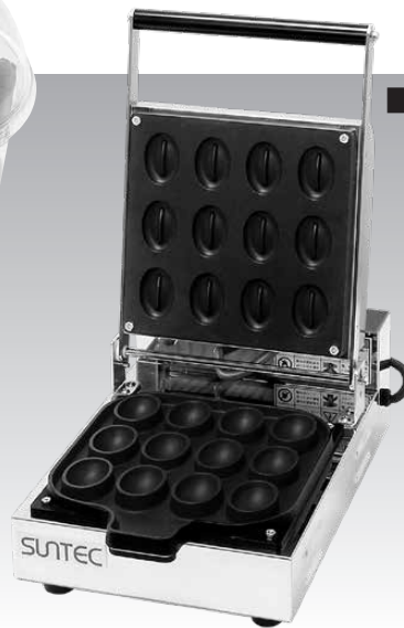
■カフェボール・ベーカー 受 SCB-1 (1連式)