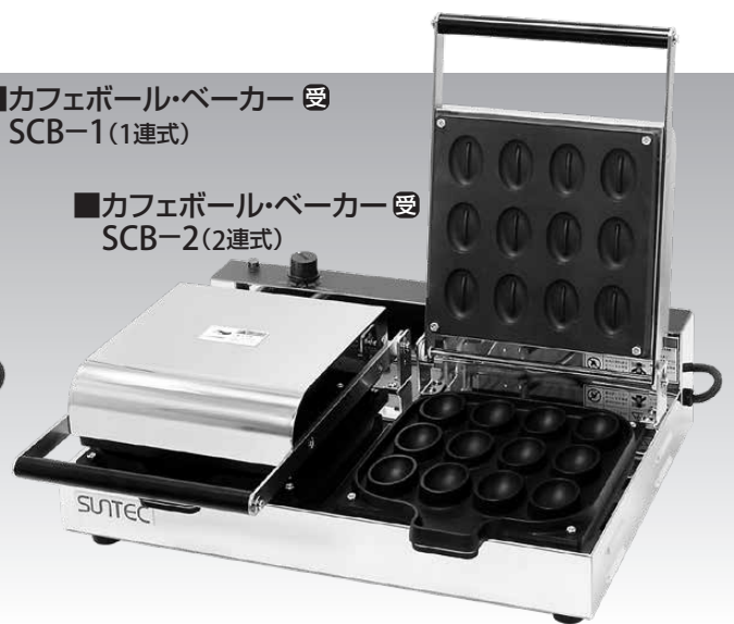
■カフェボール・ベーカー 受 SCB-2 (2連式)